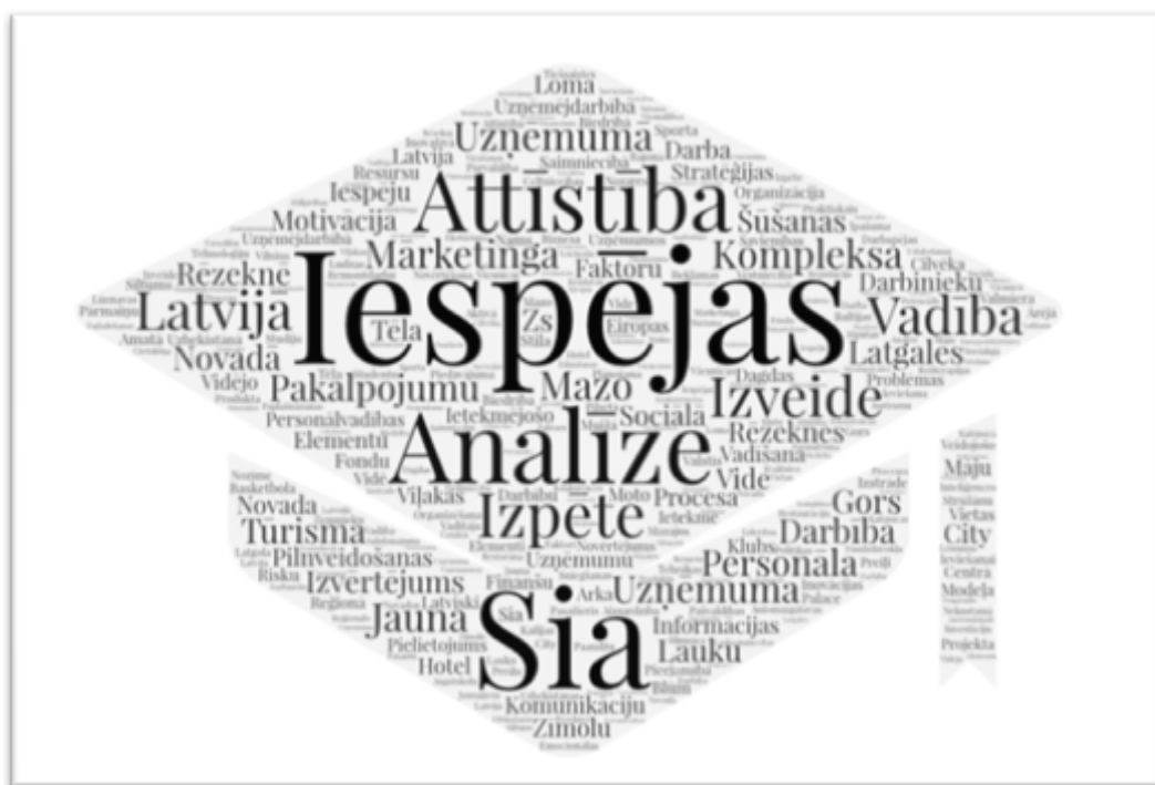
3.2.5.1. attēls. Bakalaura darbu tēmu atslēgas vārdi.

attīstības izpēte Dagdas novadā”), nekustamā īpašuma pārvaldība (“Investīciju projekta novērtējums: nekustamā īpašuma rekonstrukcija un attīstības iespējas”), metālapstrāde (“Jauna metālapstrādes uzņēmuma izveide Rēzeknē”), zemnieku saimniecības (“Risku vadība zemnieku saimniecībā “XYZ”) un daudzas citas. Plaša tematiskā aploce rāda, ka RTA absolventi mērķtiecīgi plāno uzņēmējdarbības attīstību un ir gatavi aktīvi iesaistīties tautsaimniecības izaugsmes procesā. Ģeogrāfiski bakalaura darbu tēmas aptver gan Latvijas tautsaimniecības analīzi: Latgales reģionu (Rēzekne, Daugavpils, Preiļi, Viļaka, Dagda, Ludza, Krāslava), Vidzemi (Madona, Valmiera), gan arī starpautisko uzņēmējdarbību (Lietuva, Uzbekistāna). Bakalaura darbu tēmu atslēgas vārdus skat 3.2.5.1 attēlā. Periodā no 2014.gada bakalaura darbus aizstāvējuši 74 bakalaura programmu absolventi. Zemāko pozitīvo vērtējumu (4 balles) šai posmā saņēmuši 2 absolventi, 5 balles – trīs absolventi. Augstākais vērtējums: 10 balles – 5 absolventi, 9 balles – 15 absolventi, 8 balles – 21 absolvents.