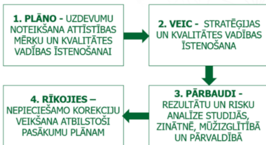
1.2. attēls. Kvalitātes nodrošināšanas cikla shēma

VeA kvalitātes vadības sistēma un tās nodrošināšanas procesi ir strukturēti atbilstoši ciklam: plāno – veic – pārbaudi – rīkojies (PVPR).