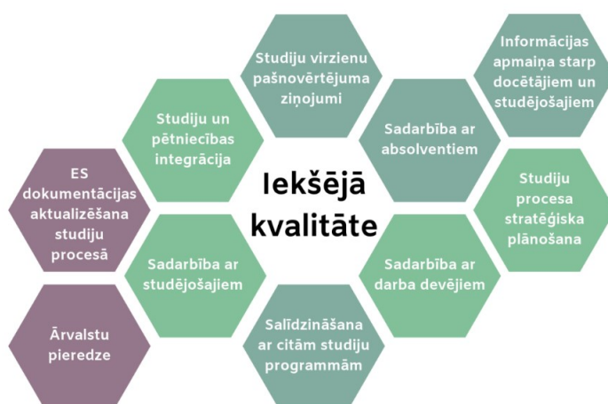
1. attēls. Studiju programmas iekšējās kvalitātes noteicošie faktori

Kvalitātes nodrošināšana ir nepārtraukts pilnveides cikls. Studiju virziena Mākslas padome sistemātiski veic studiju programmu apsekošanu un pārbaudi, izvērtējot studiju procesa norisi, rezultātus un iesakot pasākumus programmas pilnveidei un jaunāko atziņu integrēšanai studiju saturā. Atbilstošajās struktūrvienībās apspriež iesniegtos priekšlikumus un ierosina izmaiņas studiju kursu apjomā, to saturā un kalendārajā izkārtojumā pa semestriem. Vienlaikus katedrās katru semestri, ņemot vērā studējošo aptauju rezultātus un formālos studentu sekmības rādītājus, detalizēti analizē katra studiju kursa saturu un tā pasniegšanas kvalitāti. Pēc tam priekšlikumi par izmaiņām studijuursos vai studiju programmā tiek apspriesti MMF Domē, un pēc tās akcepta tie tiek virzīti uz DU Studiju padomi, kas izvērtē izmaiņu nepieciešamību. Pozitīva Studiju padomes lēmuma pieņemšanas gadījumā izmaiņas tiek apstiprinātas. Minētie izvērtējumi veicina nepārtrauktu studiju programmu pilnveidi, nodrošinot un uzturot sabiedrības vajadzībām atbilstošu studiju programmu piedāvājumu un radot atbalstošu studiju vidi. Tādējādi DU tiek apkopota, analizēta un vēlāk izmantota informācija, kas nepieciešama efektīvai studiju programmu vadīšanai. Studiju programmas īstenošanas un attīstības procesā regulāri tiek pilnveidota resursu kvalitāte un paplašināts pieejamo resursu apjoms atkarībā no attīstības prioritātēm, kas savukārt atkarīgas no izglītības un darba tirgus prasībām (skat. 1. attēlu).