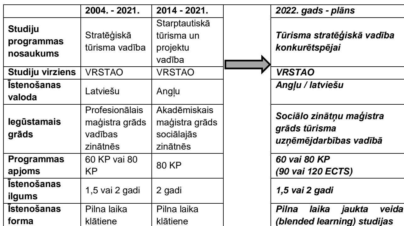
Tabula Nr. 3. Process līdz studiju programmas licencēšanas pieteikuma sagatavošanai.

Programmas starptautiskais raksturs un dubultā grāda iegūšanas iespējas noteikusi īpaši skrupulozu pieeju programmas tapšanas procesā. Tās izveidē vienlīdz iesaistīti ViA un SAMK mācībspēki, tūrisma nozares pārstāvji abās valstīs. Studiju programma jau akreditēta SAMK un atzīta par atbilstošu Somijas izglītības likumdošanas prasībām maģistra līmeņa studiju programmai.