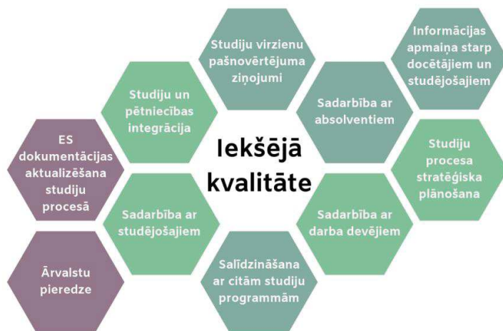
3. attēls. Studiju programmas iekšējās kvalitātes noteicošie faktori

Lai nepārtraukti pilnveidotu kvalitatīvos rādītājus un kopējo sniegumu AII stratēģijas vadlīniju izpildē, tiek noteikti konkrēti mērķi izglītošanā, zinātniskajā darbībā un inovācijās, vadības pasākumu, infrastruktūras un darba vides pilnveidošanā, kā arī konkrēti uzdevumi šo mērķu īstenošanai, piemēram,